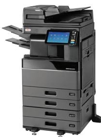
ES9466 MFP mit DSD, PPF, Schubladenmodul und integriertem Finisher vorinstalliert