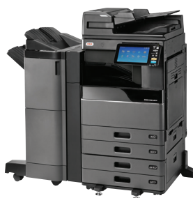
ES9466 MFP mit DSD, PPF, Schubladenmodul, Mehrfachheft-Finisher und Lochereinheit vorinstalliert