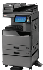
ES9466 MFP mit DSD und Schrank